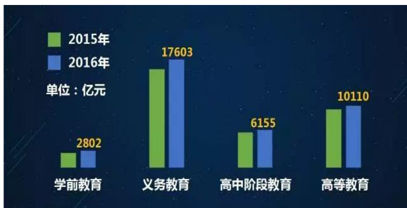
图表 7. 2015-2016 年国家教育经费在各级教育间分布情况