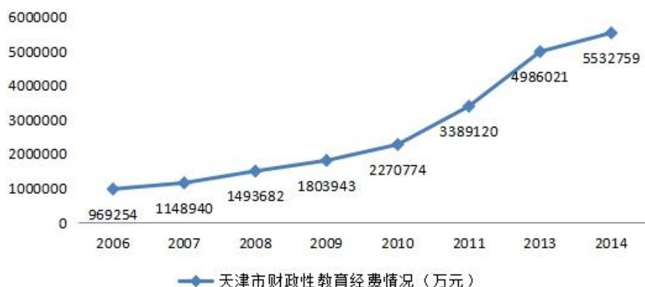
图表 6. 2006-2014 年天津市财政性教育经费情况 (万元)

近年来，天津市逐年加大教育的投入力度，地方财政性教育经费从 2006 年的 96.93 亿元增长至 2014 年的 553.28 亿元，增长了 4 倍多。